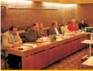
Sitzung der LAG Vogelpark-Region