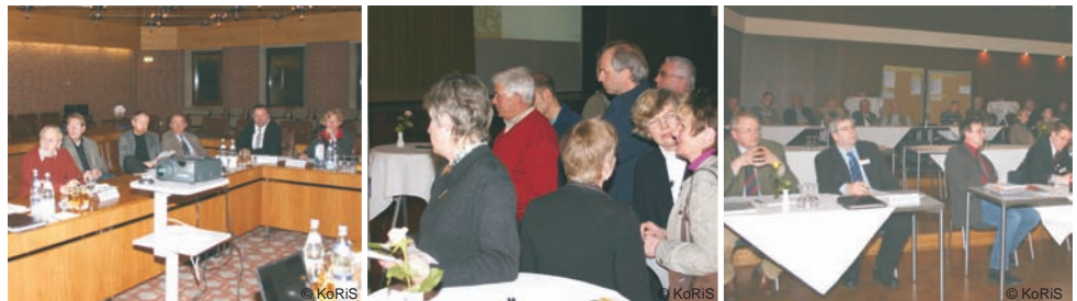
Veranstaltungen in der Vogelpark-Region

EUROPÄISCHE UNION Europäischer Landwirtschafts- fonds für die Entwicklung des ländlichen Raums: Hier investiert Europa in die ländlichen Gebiete